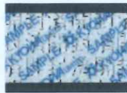
再度同じものを 貼付した時