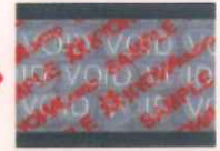
再度同じものを 貼付した時

【セキュリティ粘着テープ(転写タイプ)】 【セキュリティ粘着テープデラミ(非転写タイプ)】 規格サイズ